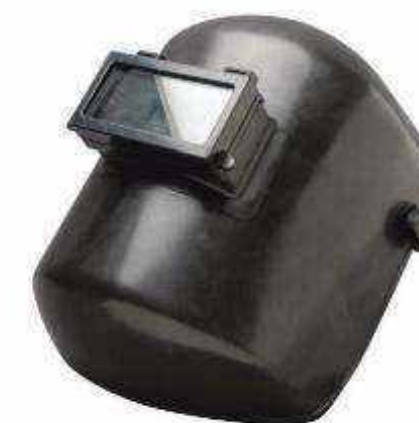
CARETA VENTANA LEVANTABLE CARETA-FVVL