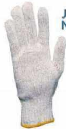
JAPONES NATURAL GTJAP-B