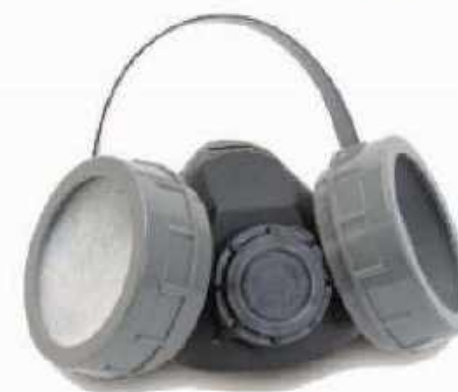
RHH2T Respirador de dos cartuchos