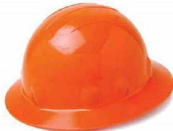
CASCO TIPO MINERO CASCO E