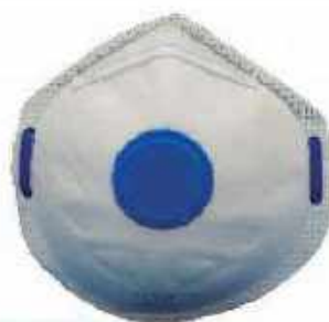
1730 Con sello contorno y válvula de exhalación