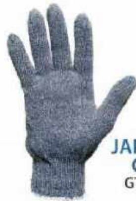
JAPONES GRIS GTJAP-G