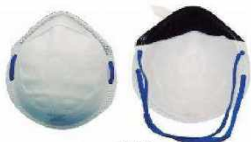
1710 Puente nasal sencillo