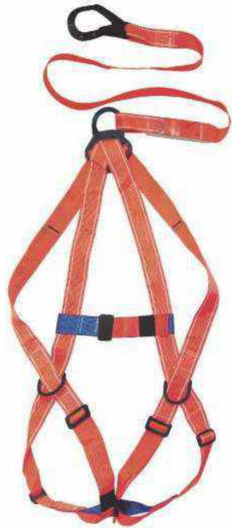
A3A-D ARNÉS DIELECTRICO 3 ARGOLLAS