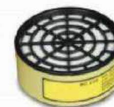
RC-205 Gases ácidos