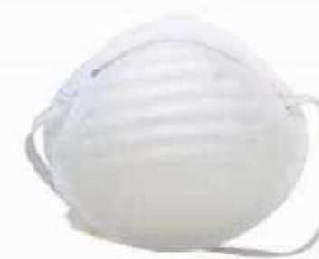
1501 ◦ Mascarilla sencilla 1 liga. ◦ Con puente nasal.