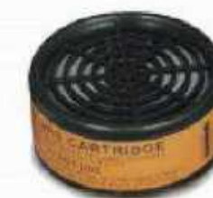
R-622 Vapores orgánicos y pinturas