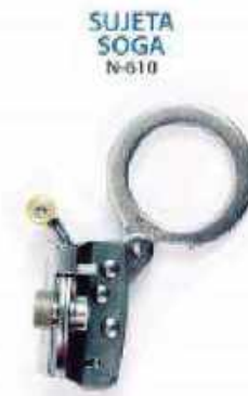
SUJETA SOGA N-610