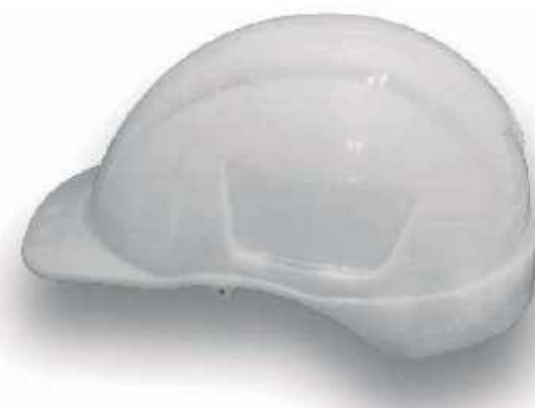
CASCO RESCATISTA CASCO RESC