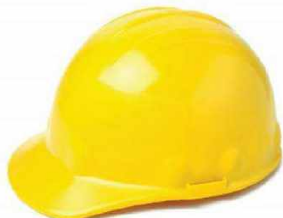
CASCO TIPO CACHUCHA CASCO