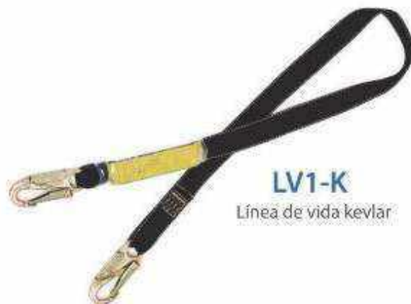
LV1-K Línea de vida kevlar