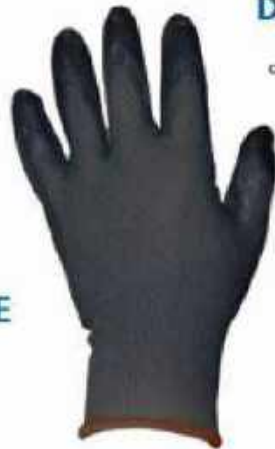
GUANTE CON RECUBRIMIENTO DE NITRILO GTNN ◦ Buen agarre, abrasión y pinchaduras