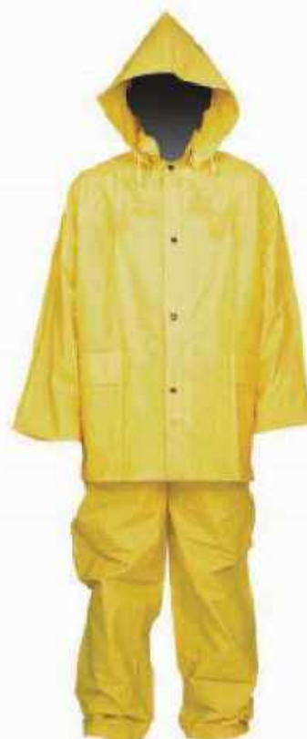
IMPER 3 Tres piezas