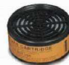
R-621 Vapores orgánicos