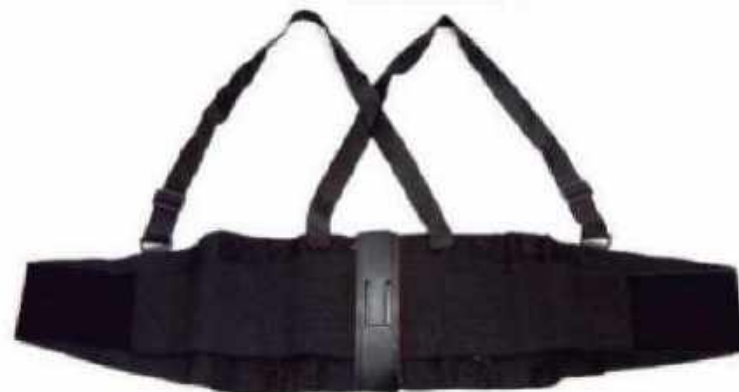
FAJA REFORZADA 8" FET84R

Fajas 100% elásticas color negro, tirantes 1 1/4" de ancho y ajustables 4 varillas laterales 1/2" y central de 1 3/4"