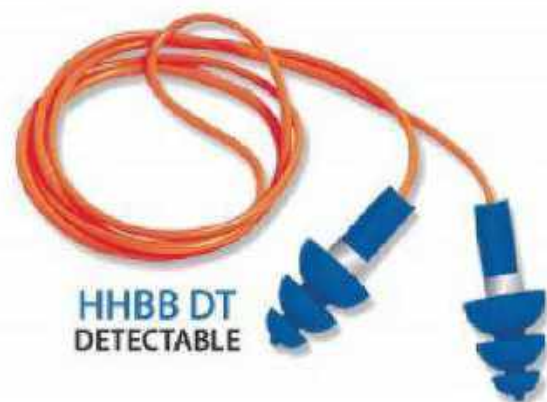
HHBB DT DETECTABLE