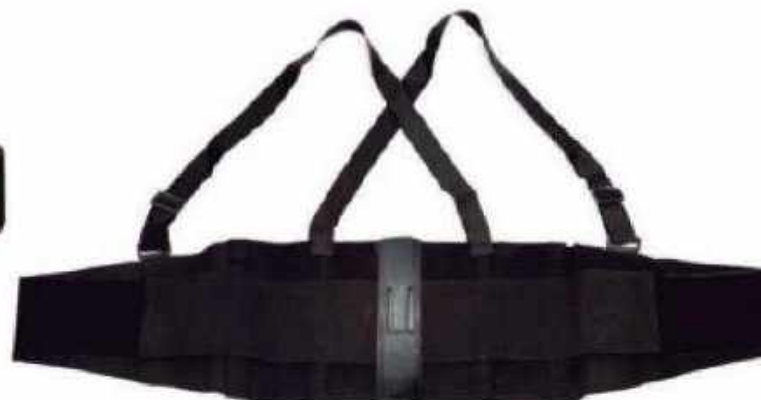
FAJA REFORZADA 8" FET85

*Base elásticos 5 pulgadas, parte lumbar con 9.5 pulgadas *Refuerzo doble de 4 pulgadas