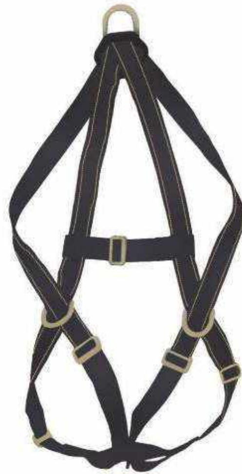
A3A-K ARNÉS CON KEVLAR 3 ARGOLLAS