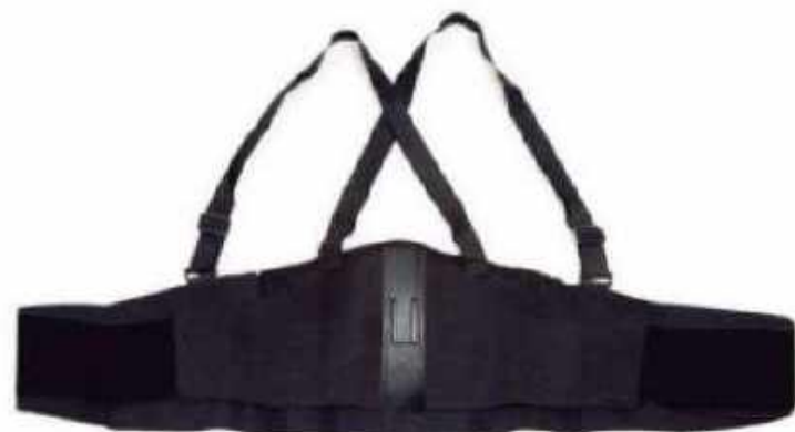
FAJA REFORZADA 9.5" FETH

LAS FAJAS ELÁSTICAS BRINDAN SOPORTE FIRME Y CONFORTABLE EN LA PARTE BAJA DE LA ESPALDA Y REGIÓN ABDOMINAL