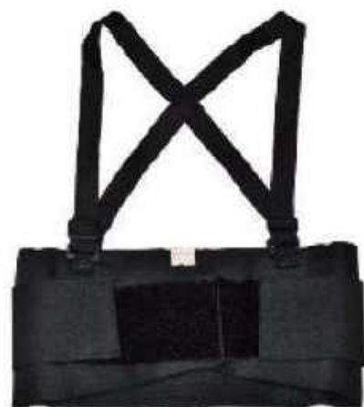
FAJA REFORZADA 8" FET84

*Base elásticos 8 pulgadas, *Refuerzo de elástico sencillo de 5 pulgadas