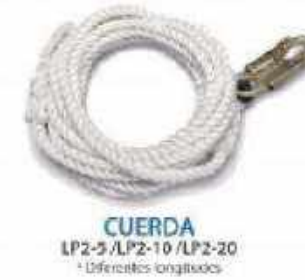
CUERDA LP2-5 / LP2-10 / LP2-20 * Diferentes longitudes