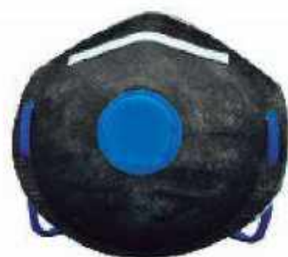
1750 Con carbón activado, sello contorno completo y válvula de exhalación