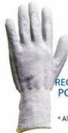
GUANTE CON RECUBRIMIENTO DE POLIURETANO GTNPU ◦ Flexible ◦ Alta maniobrabilidad