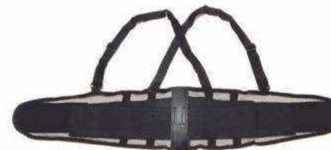
FAJA VENTILADA 8" FETV4R

° Base de poliéster ventilado de 8 pulgadas de ancho ° Refuerzo doble de elástico de 4 pulgadas