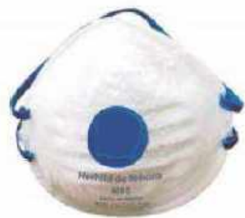
1630 Con sello contorno y válvula de exhalación