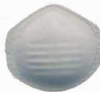
1500 ◦ Mascarilla sencilla 1 liga. ◦ Sin puente nasal