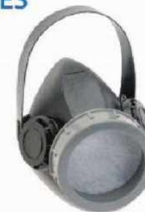
RHH1T Respirador de un cartucho