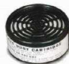
R-620 Polvos no tóxicos