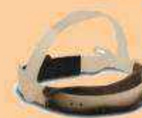
S-3 Con ajuste de matraca