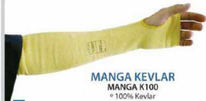
MANGA KEVLAR MANGA K100 ◦ 100% Kevlar