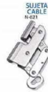
SUJETA CABLE N-621