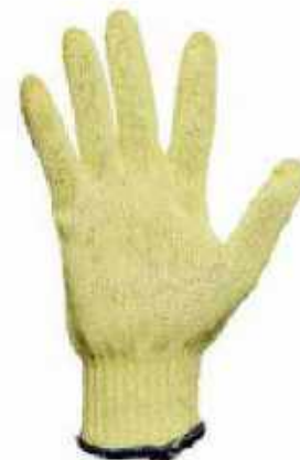
KEVLAR GTKPM ◦ Peso medio