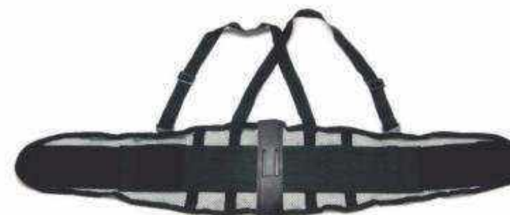
FAJA VENTILADA 8" FETV4

° Base de poliéster ventilado de 8 pulgadas de ancho ° Refuerzo doble de elástico de 4 pulgadas