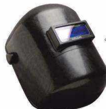
CARETA-FV Termoplástica con 30% fibra de vidrio Suspensión de matraca