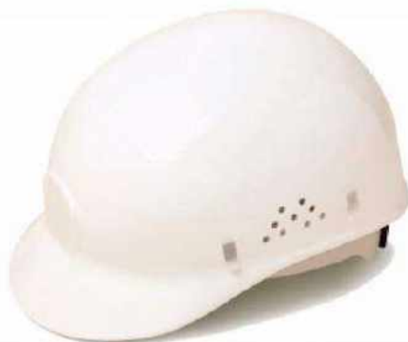
CACHUCHA HIGIÉNICA BCAP