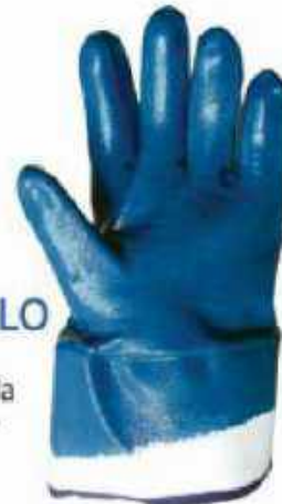
LONETA NITRILO GTN-LONETA ◦ Alta resistencia a la abrasión, grasas y aceites