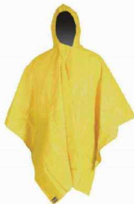
CAPAMANGA MANGA-A tela PVC MANGA-L tela Laminada