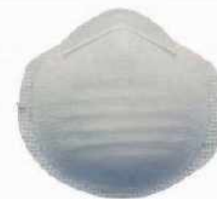
1500-PTE ◦ Mascarilla sencilla 1 liga. ◦ Con puente nasal