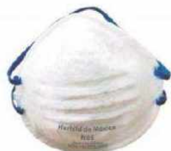
1610 Puente nasal sencillo

◦ Mascarillas de 2 ligas para polvos y vapores no tóxicos y partículas mayores a 0.05ppm N95