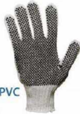
JAPONES con PVC GTJAP-PVC ◦ Mejor agarre