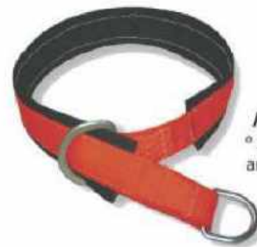
ANCLA2 ° Soporte y anillo de 3"