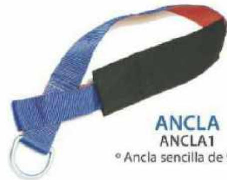
ANCLA ANCLA1 ° Ancla sencilla de 90cm